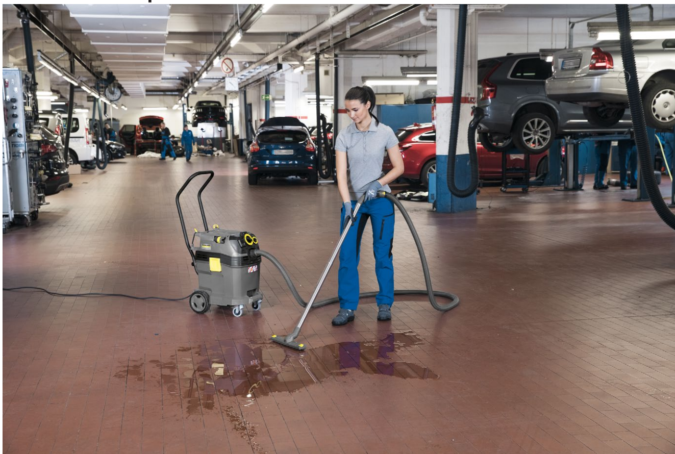
NT 40/1 Tact Te L