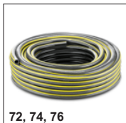
72, 74, 76