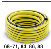
68–71, 84, 86, 88