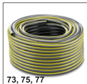
73, 75, 77