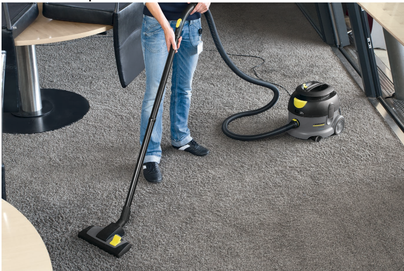
T 12/1 ecoefficiency