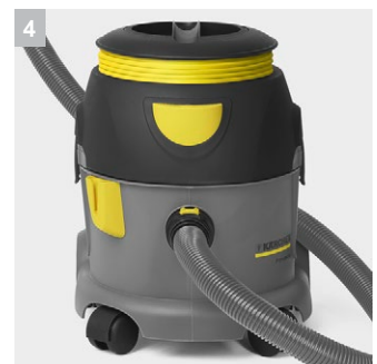
4 Хранение шнура на борту