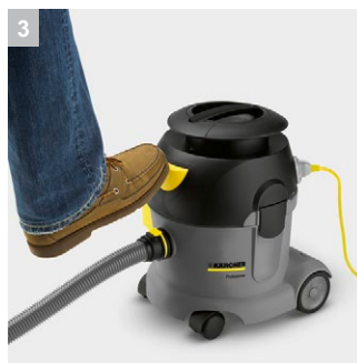
3 Ножной выключатель для удобства использования