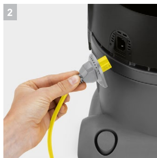
2 Удобство обслуживания