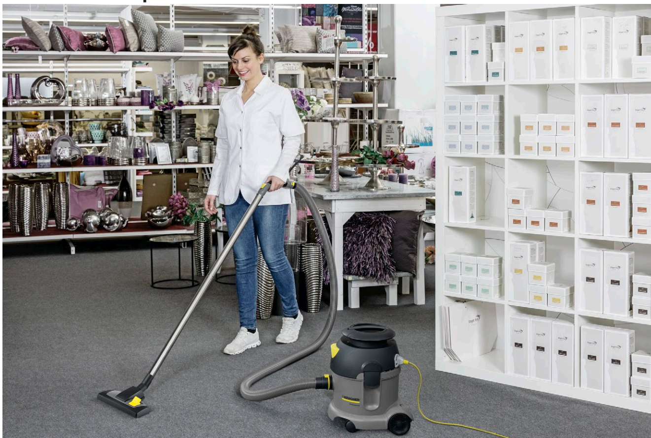
T 10/1 Adv