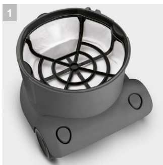
1 Большой перманентный фильтр круглой формы из моющегося нейлона

Пылесос T 10/1 - бюджетное профессиональное решение. Этот эргономичный пылесос начального уровня гарантирует удобное и качественное выполнение любых уборочных работ. Оснащен особо прочным основным фильтром, ножным выключателем, антистатическим коленом и держателями для принадлежностей.